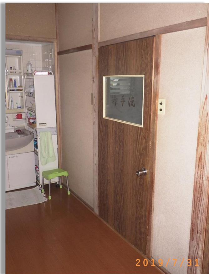
■現状写真■ (工事施工前)