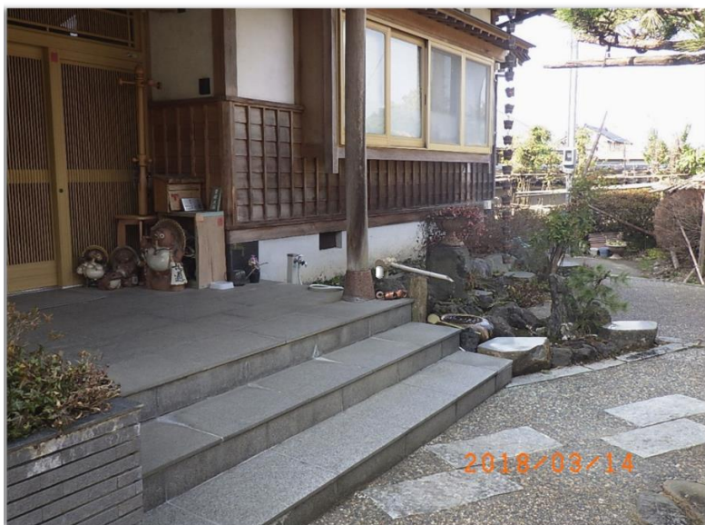
■現状写真■ (工事施工前)