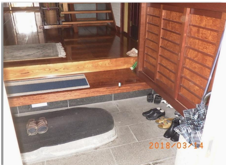
■現状写真■ (工事施工前)