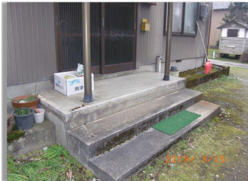
■現状写真■ (工事施工前)