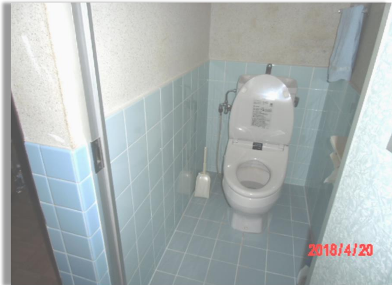
■現状写真■ (工事施工前)