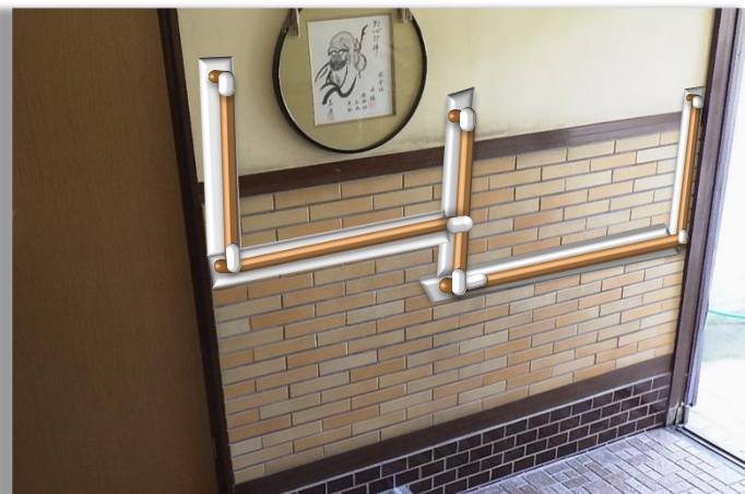
■改修計画■ (イメージ)