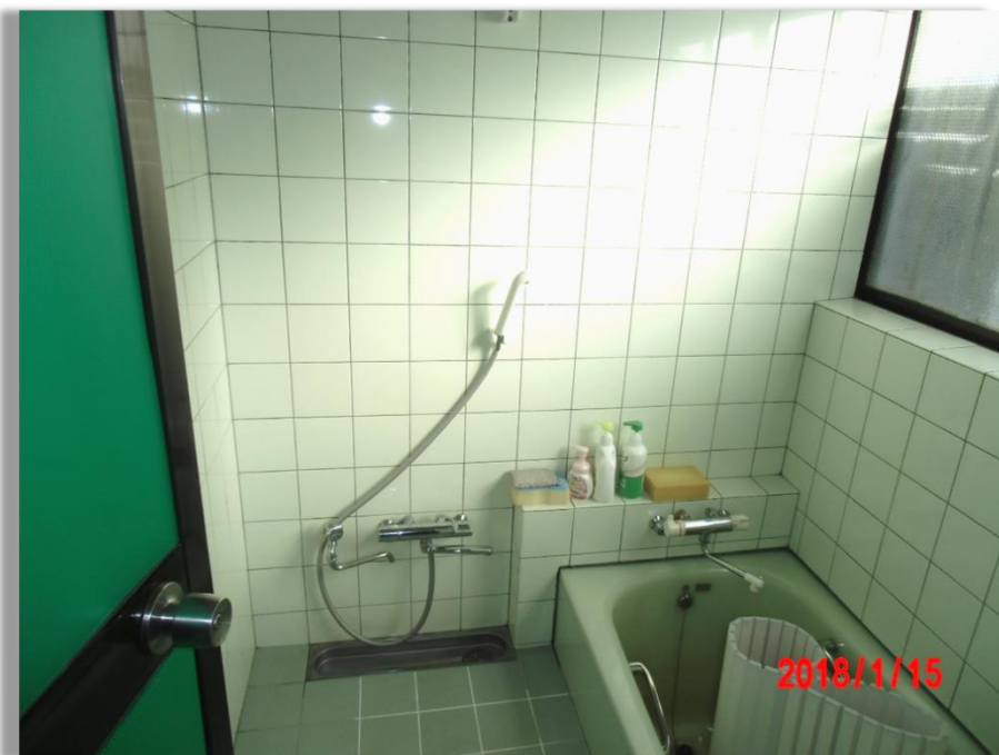
■現状写真■ (工事施工前)