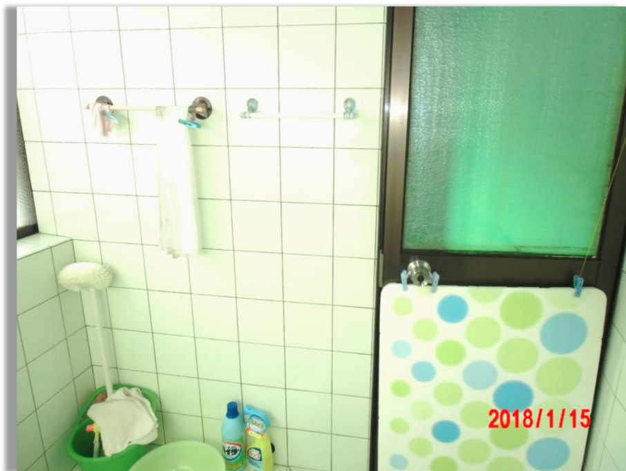
■現状写真■ (工事施工前)