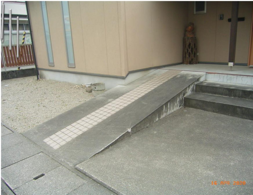
■現状写真■ (工事施工前)