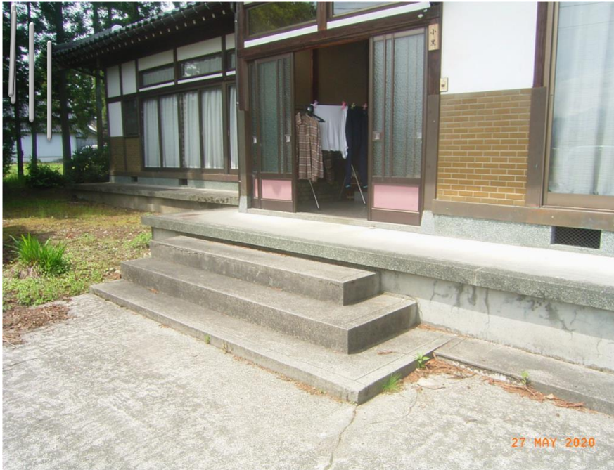
■現状写真■ (工事施工前)