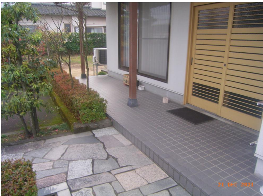
■ 現状写真 ■ (工事施工前)