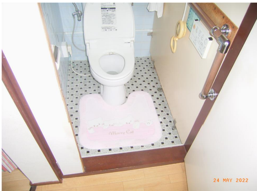
■現状写真■ (工事施工前)