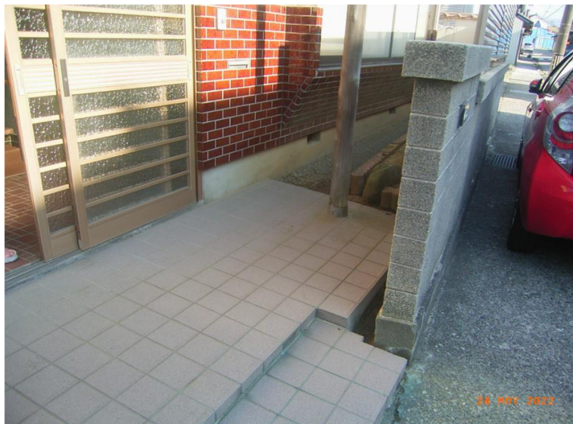
■現状写真■ (工事施工前)