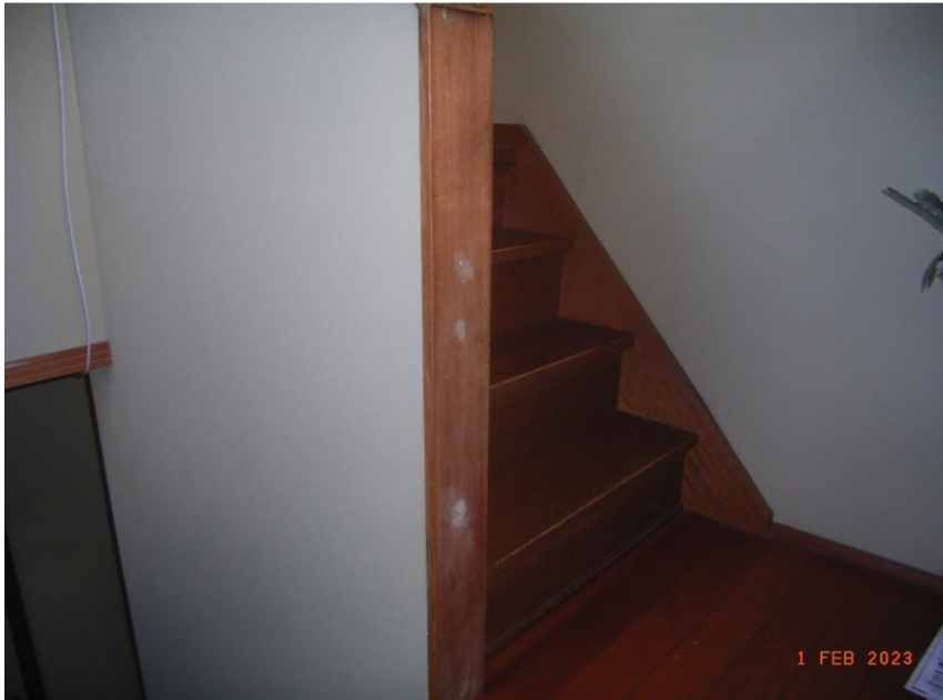
■現状写真■ (工事施工前)