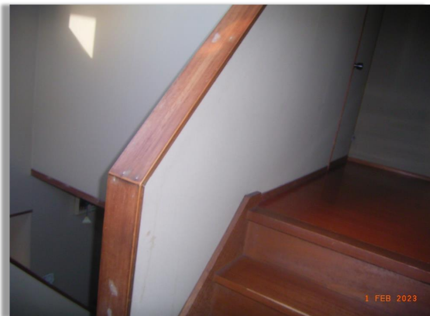
■現状写真■ (工事施工前)