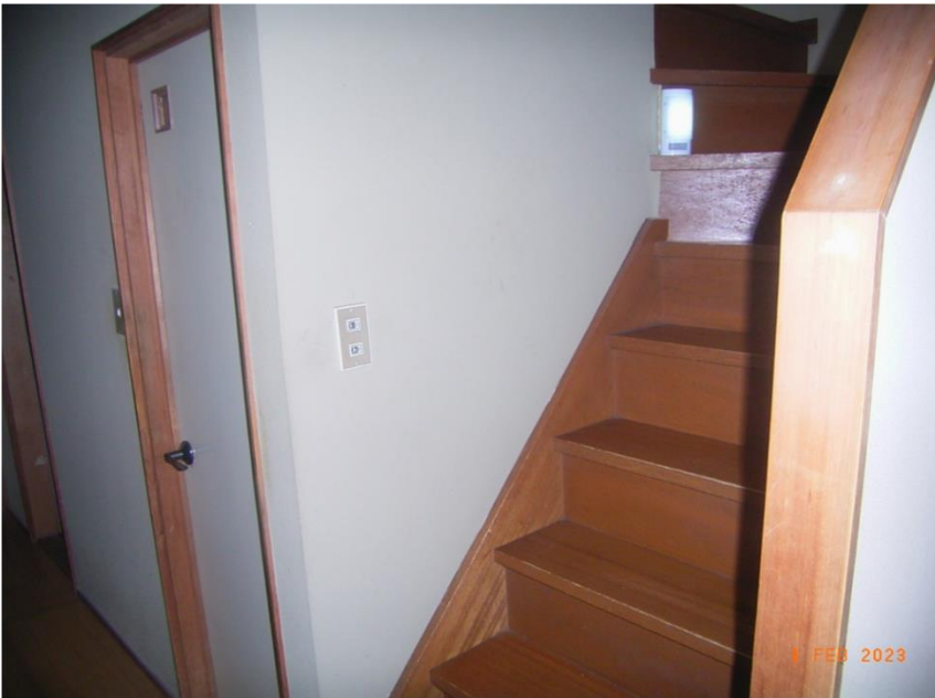
■現状写真■ (工事施工前)