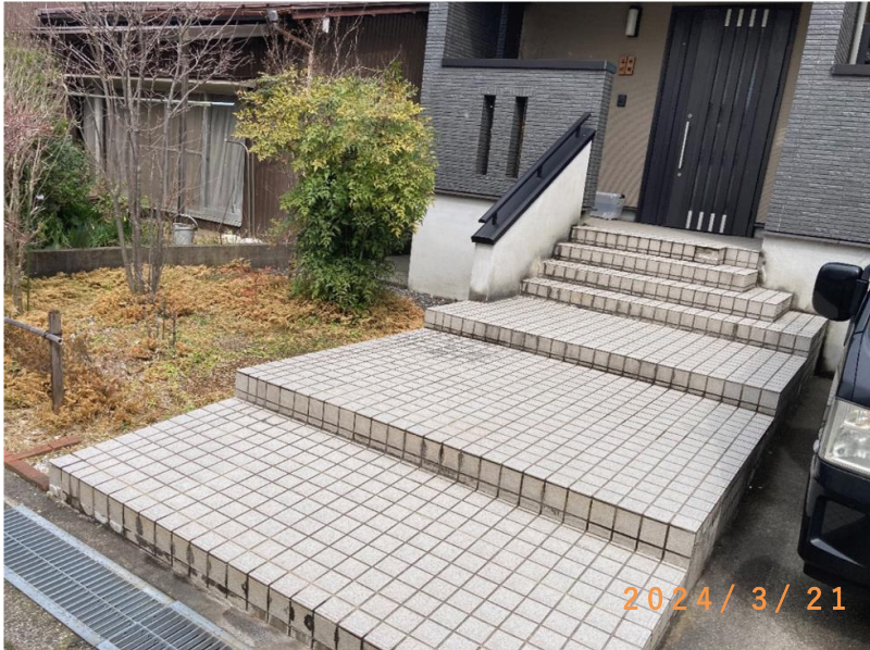
■現状写真■ (工事施工前)