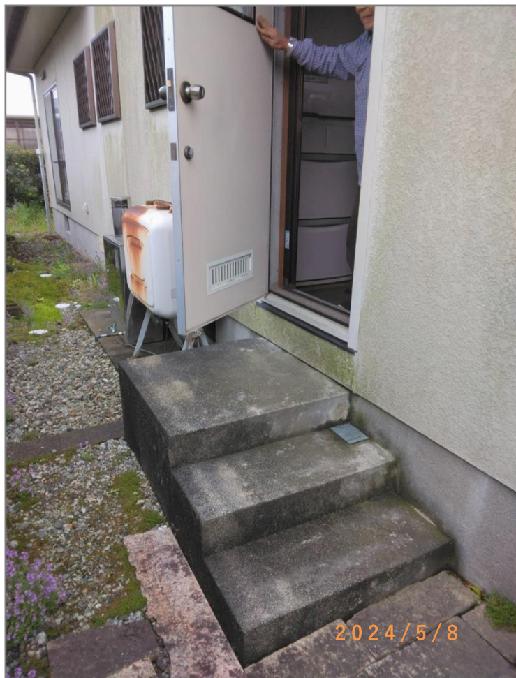
■現状写真■ (工事施工前)