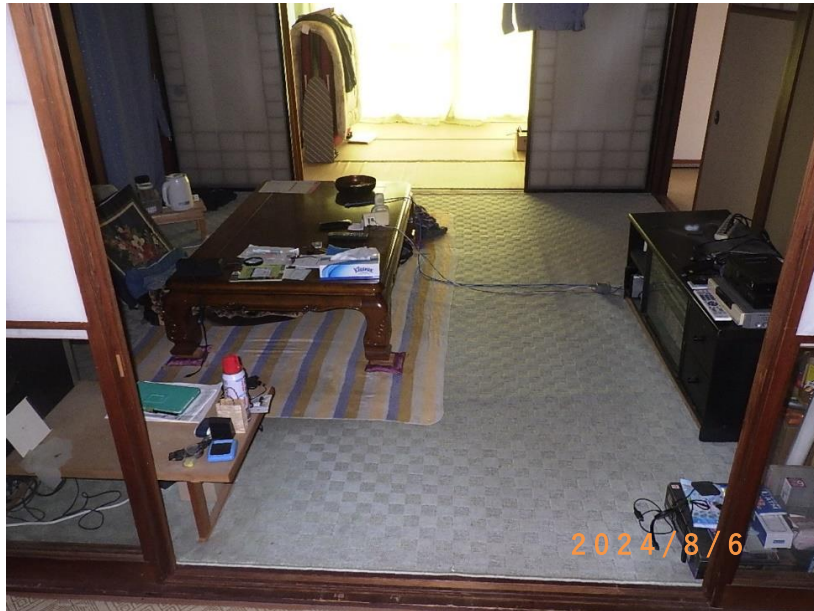
■現状写真■ (工事施工前)