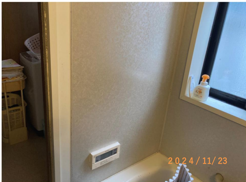
■現状写真■ (工事施工前)