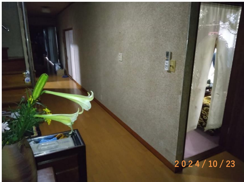
■現状写真■ (工事施工前)